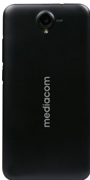
CODICE: M-PPAS6 Versione matt black CODICE EAN: 8028153091111