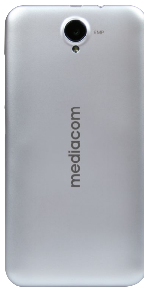
CODICE: M-PPBS6 Versione dark silver CODICE EAN: 8028153091128