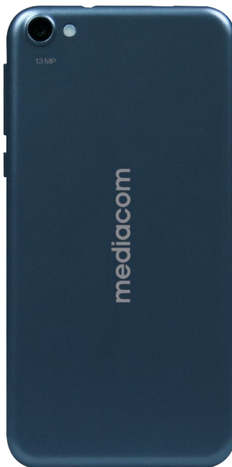
CODICE: M-PPAS5P Versione petrol blue CODICE EAN: 8028153091104