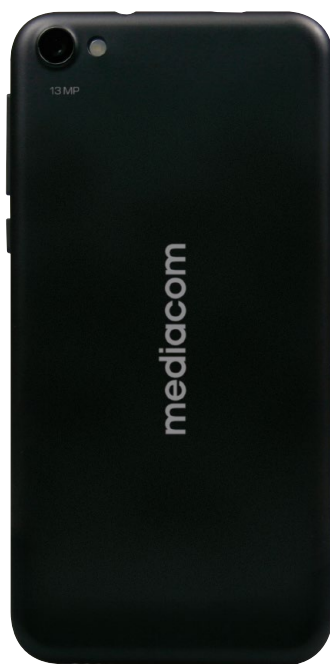
CODICE: M-PPAS5P Versione matt black CODICE EAN: 8028153091098