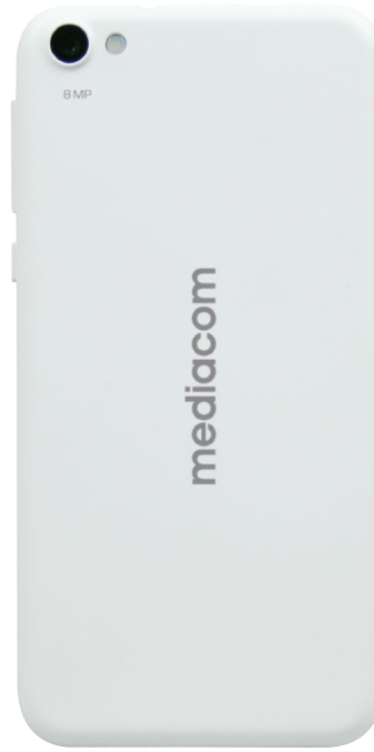
CODICE: M-PPBG5 Versione white CODICE EAN: 8028153091067