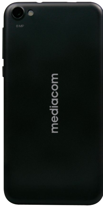
CODICE: M-PPAG5 Versione matt black CODICE EAN: 8028153091050